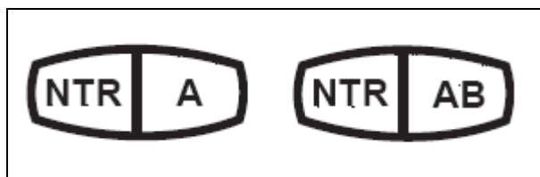
Figur 1 De vanligaste märkningarna NTR A och NTR AB innebär att virket kan användas i kontakt med mark och sötvatten respektive ovan mark.

Impregnerat trä enligt dessa träskyddsklasser är producerade enligt gemensamma nordiska regler som utarbetats av NTR och som baseras på europeiska standarder. I Sverige har SP Sveriges Tekniska Forskningsinstitut ansvaret för kvalitetskontroll och certifiering av impregnerat trä som produceras enligt NTR regelverk. Företag som producerar kvalitetskontrollerat, impregnerat trä får märka sitt virke med det s.k. NTR-märket (se Figur 1), som också visar till vilka huvudsakliga användningsområden virket kan brukas.