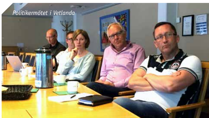
Politikermötet i Vetlanda